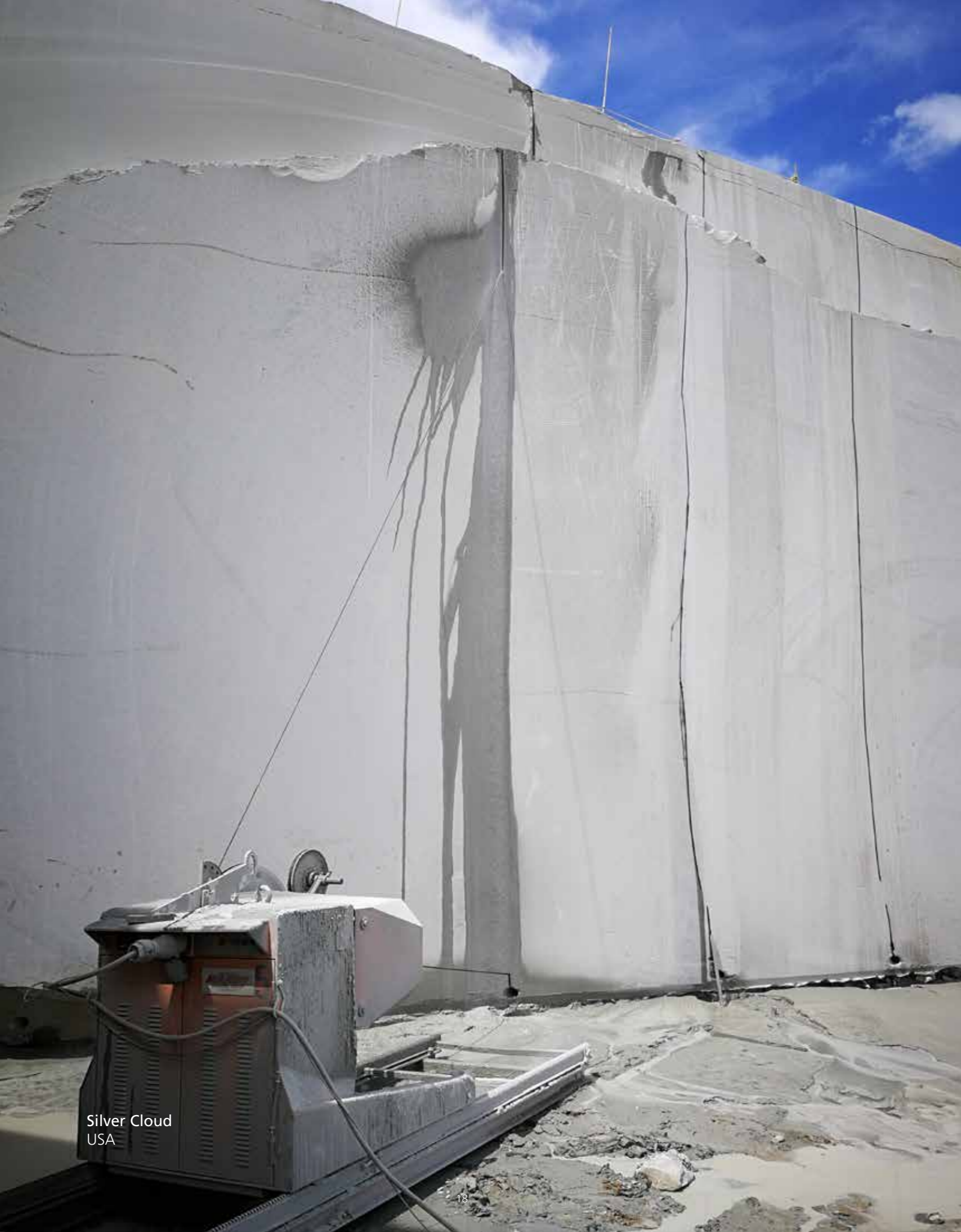
Silver Cloud USA