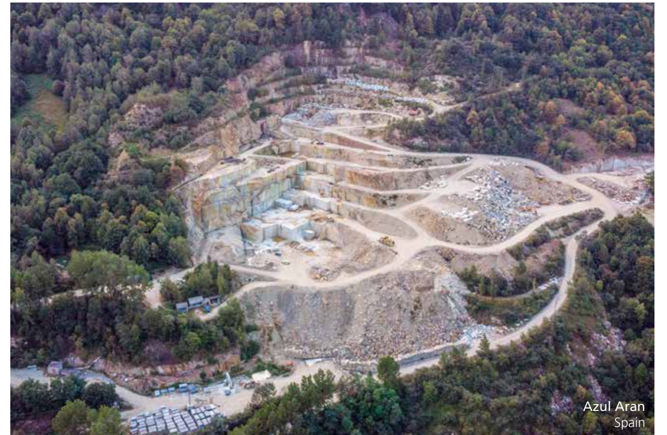
Azul Aran Spain